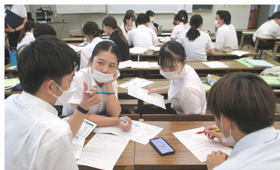
グループワーク講座の様子

第二次選考試験の内容である、「模擬授業」「個人面接」「英会話」「グループワーク」については、第一次選考試験に合格した学生（本年度は100%合格なので、もちろん全員です！）を対象に指導しました。