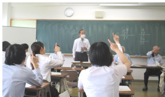
熱心な取組みが現役合格への近道

教職教養は、教育現場で教師として働くために必要な教育理論、教育心理学、カリキュラム開発、教育法規、教育技術などの基礎的な概念や方法論です。これらの知識やスキルは、教育者が効果的に教育を提供し、子どもたちの成長や学習を支援するために重要です。教員になるにあたって知っておくべき知識として出題されます。この講座では、全領域を網羅しながら出題の可能性の高い内容について重点的な指導が行われました。