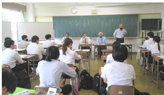
特別対策講座の開講

小中高等学校それぞれで指導する教科を中心に、出題される問題に対応しました。特に、小学校教員採用試験では主要4教科（国語・社会・算数・理科）に限定して出題する自治体もありますが、本講座では、全教科に対応しました。教科数が多いことから、苦手意識を極力なくすよう繰り返し指導が行われました。また、各教科とも「教科目標」「各学年の目標」「指導計画の作成と内容の取扱い」がよく出題されることから、重要語句を中心として確実に内容を把握できるような講座内容でした。