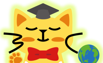
宮崎国際大学マスコットキャラクター MIU