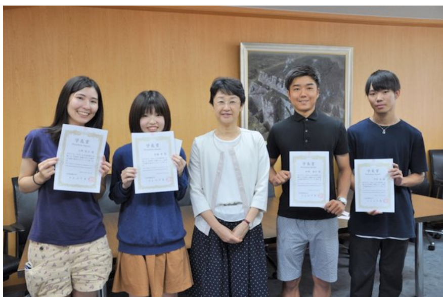
国際教養学部学生